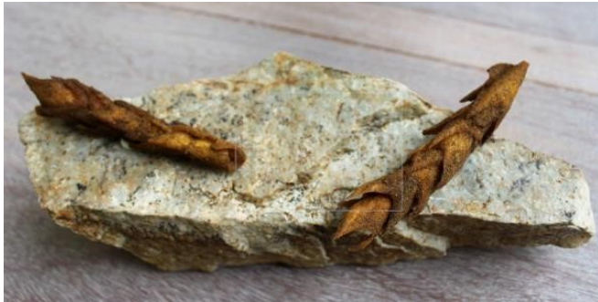
Un plato Arracacha crocante.

Los cultivos andinos como la arracacha, el tarwi o la cañahua, considerados como "subvalorizados" por la poca producción y uso en esta región, ahora llaman la atención de mercados españoles por su alto valor nutritivo gracias a un programa para la conservación y promoción de estos alimentos.