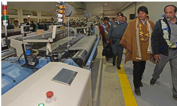
El Presidente Evo Morales en la inauguración de la empresa Yacana.

La planta de transformación de fibra de camélidos de la empresa estatal Yacana fue inaugurada en un masivo acto realizado en el municipio de Laja. El Presidente Evo Morales y el Vicepresidente Álvaro García Linera encabezaron el acto de entrega.