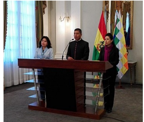
Canciller Fernando Huanacuni en conferencia de prensa

A su juicio todos los acuerdos insertados en el documentos final de la XIII reunión del Comité de Fronteras tienen un "enorme" interés para ambos países y reiteró que ese paso abre puertas para espacios de diálogo. "Todos los espacios de diálogo alimentan la confianza entre los países, es muy importante tener los puntos de encuentro por eso este mecanismo del Comité de Fronteras, no solamente es una reunión técnica, es un encuentro de dos países", puntualizó.