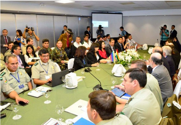
Les délégués chiliens et boliviens à la réunion du Comité sur les frontières à Santa Cruz.

Le dialogue technique s'est décongelé entre la Bolivie et le Chili. Lors du treizième Comité sur les frontières entre la Bolivie et le Chili, il a été convenu, entre autres, que des représentants des deux pays se réuniraient pour discuter des questions de douanes, des conflits aux frontières et du marquage des limites établies, lors du quatorzième Comité sur les frontières entre la Bolivie et le Chili, qui se tiendra les 25 et 26 octobre à Arica, au Chili.