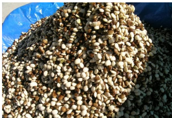
Granos de tarwi

nutricional de cada producto andino que luego estará disponible en línea para que sea de libre acceso", agregó Delgadillo.