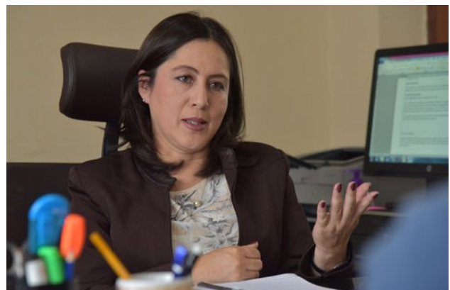
La Viceministra de Gestión Institucional y Consular, Carmen Almendras.

Además, anunció Almendras, "Bolivia quiere pasar de un enfoque de atención consular a uno que abarque mayor defensa de los derechos humanos de los ciudadanos bolivianos que residen en el exterior".